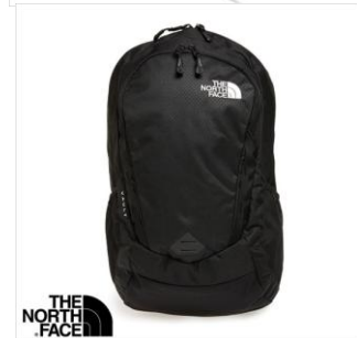
THE NORTH FACE