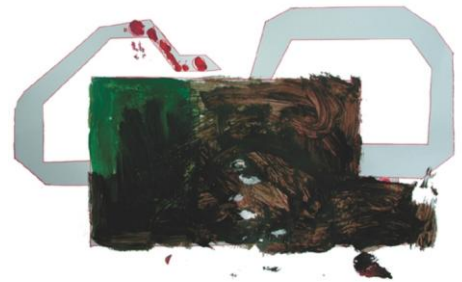
Fra ingenting til frugt From nothing to fruit

Lige nu søger vi flere foreninger, klubber, klasser, børnehaver mv. som har lyst til at sælge vores Lillebror Lotteri 2018 . Salgsperioden er 15. marts - 28. maj. Foreningen / klassen mv. sælger et lod for en